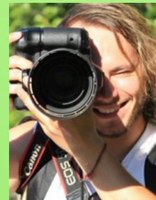
Photo à envoyer à M. Simoni sur l'ENT ou apporte-lui une clé USB en B 204 entre le 6 et le 17 Mars. Résultats le 17 MARS à 18h

Atelier Réparation Vélo et trott avec l'association MDB d'Eaubonne: viens faire 1 diagnostic de ton vélo ou ta trott et apprendre à les réparer.